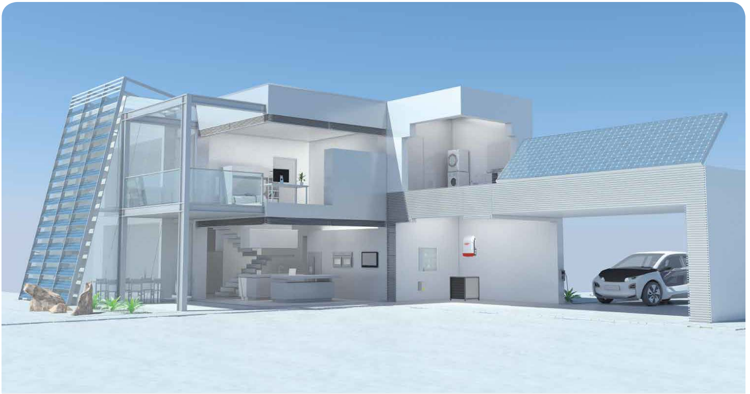
DIAGRAMMA DELLA CONFIGURAZIONE DEL FRONIUS ENERGY PACKAGE